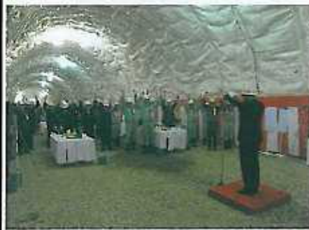
貫通を祝して出席者全員による万歳三唱。