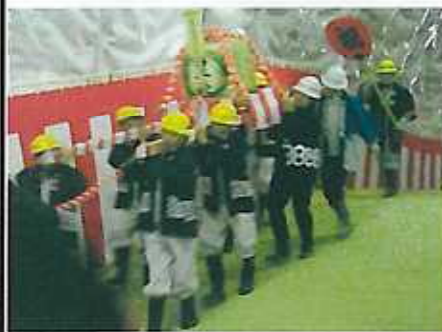
トンネル工事に従事した 山の男達による樽神輿。