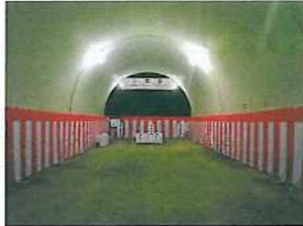
式典会場 貫通発破地点の様子です。