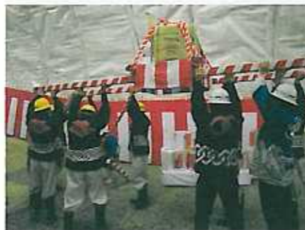
樽神輿を勢よく担ぎ上げます。