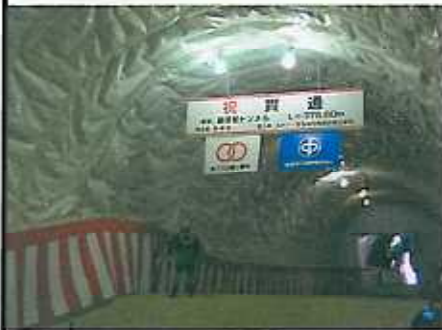
貫通点のお清めを行っています。