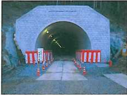
式典会場 入り口の様子です。