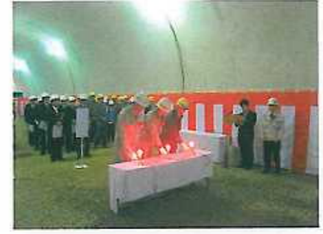
司会の合図にあわせて点火！ 発破音が坑内に響き渡りました。