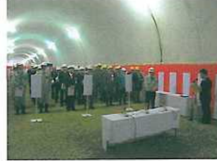
貫通式が始まりました。