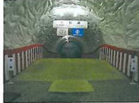
式典会場 貫通点の様子です。