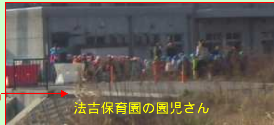
法吉保育園の園児さん